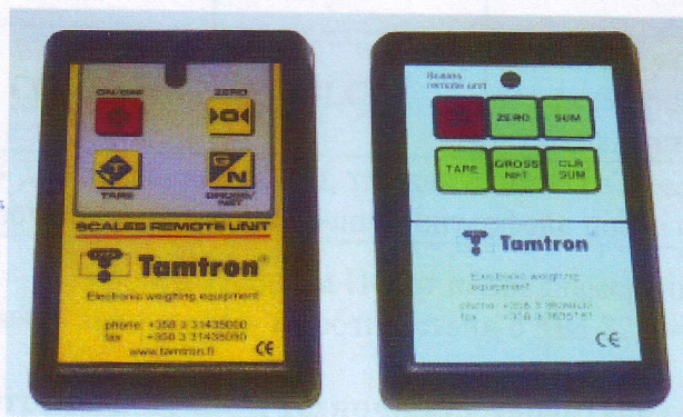
Рисунок 2 - Пульт ДУ на ИК-лучах